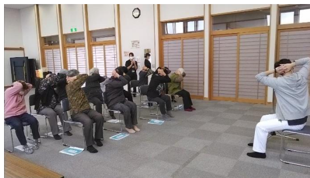
転倒予防体操の様子