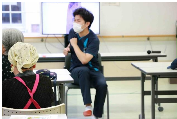
転倒予防体操の様子